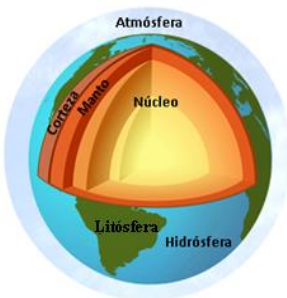
Ilustración: Composición interna y externa de la tierra

Composición y estructura de la tierra: La Tierra pertenece a los planetas terrestres, es un cuerpo rocoso y no gaseoso. Se compone de distintas capas internas geológicas (núcleo, manto y corteza) que consiguen crear el ambiente idóneo para que pueda albergar vida. Y capas externas (atmósfera, litosfera, hidrosfera) que nos permiten respirar y poder vivir tranquilamente en nuestro planeta.